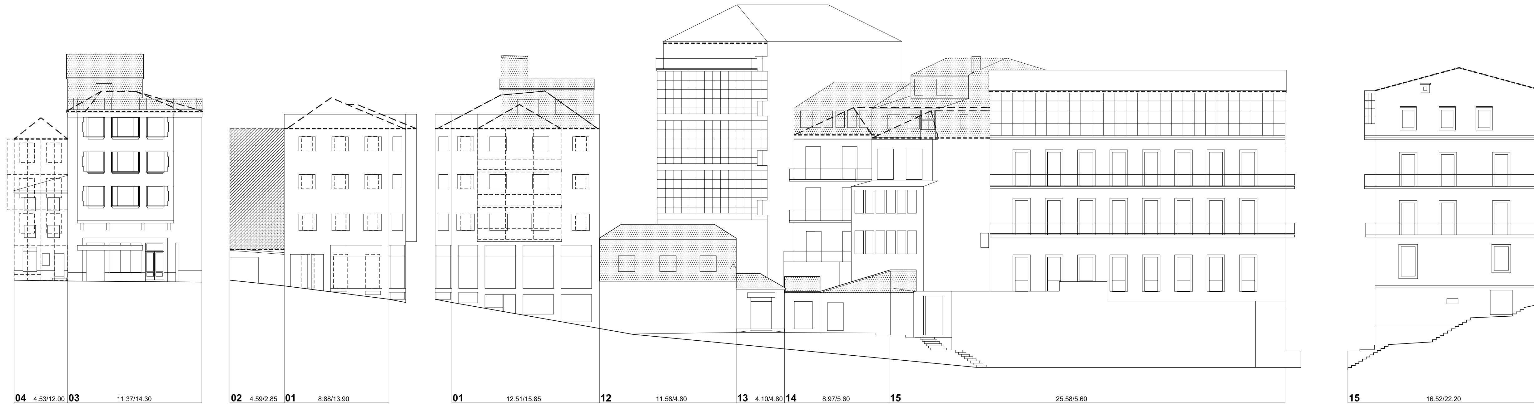
Praza da Pedra